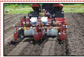
★:水田農業生産性向上緊急対策