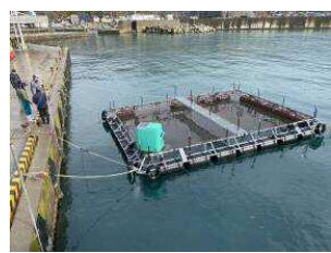
サーモン養殖(岩館漁港)